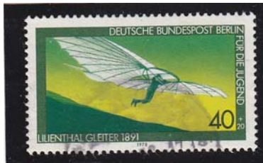
Lilienthal Gleiter 1891 Bundespost Berlin 1978