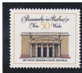
Neue Wache DDR 1971