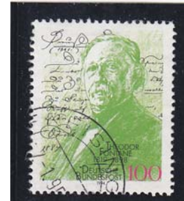
Deutsche Bundespost 1994