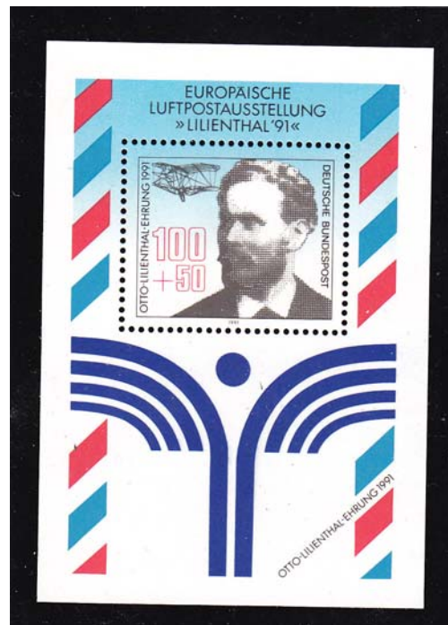
Europäische Luftpostausstellung, Lilienthal 91 Deutsche Bundespost 1991