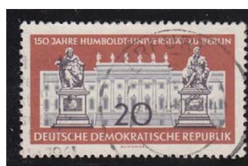
150 Jahre Humboldt Universität Berlin DDR 1960