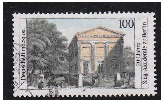
200 Jahre Sing-Akademie in Berlin Deutsche Bundespost 1991