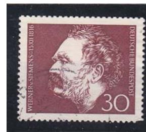
Deutsche Bundespost 1966