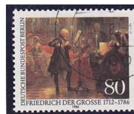
Flötenkonzert Friedrichs des Großen Gemälde von Menzel Bundespost Berlin 1986