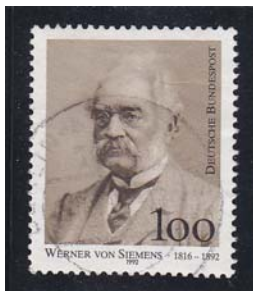
Deutsche Bundespost 1992