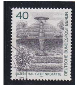
Lilienthal Gedenkstätte Bundespost Berlin 1980