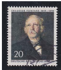
Bundespost Berlin 1970