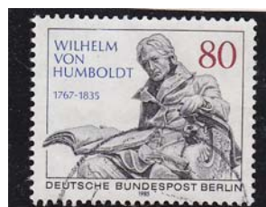
Bundespost Berlin 1985