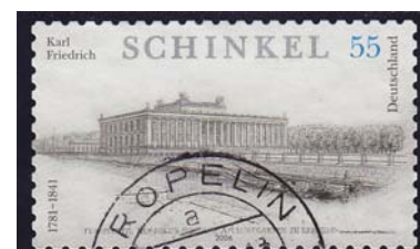
Altes Museum Deutschland 2006