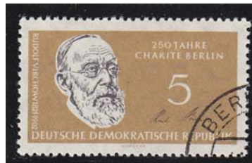
250 Jahre Charite DDR 1960