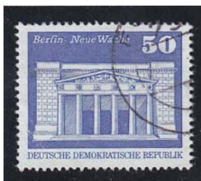
Neue Wache DDR Freimarke