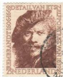
Selbstbildnis (1639) Mi 676