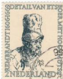
Bauer mit hoher Mütze (1639) Mi 672