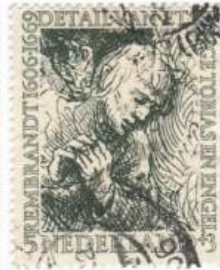
Der junge Tobias u. Engel (1641) Mi 673