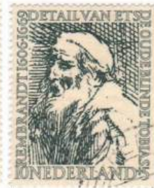
Der alte, blinde Tobias (1651) Mi 675