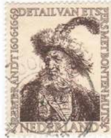
Perser mit bunter Mütze (1632) Mi 674