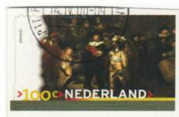
Die Nachtwache (Offiziere und Wachmänner der Amsterdamer Bürgerwehrkompanie von Kapitän Frans Banning Cocq und Leutnant Willem van Ruytenburgh, 1642) Mi 1801 Mi 1805