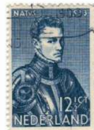
PORTRAITS VON WILHELM I. VON ORANIEN

H.Goltzius, 1558-1617 Kupferstecher, Maler und Zeichner, Einfluß italienischer Meister Mi 258