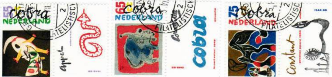
Der Papierdrache von Corneille Mi 1347