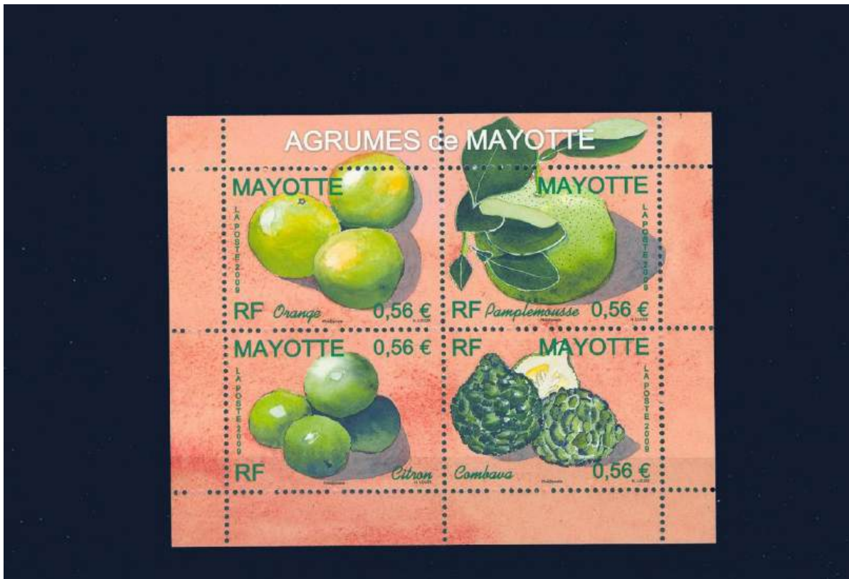
Block mit Obst: Orange, Pampelmuse, Zitrone, Combawa= Limettenart