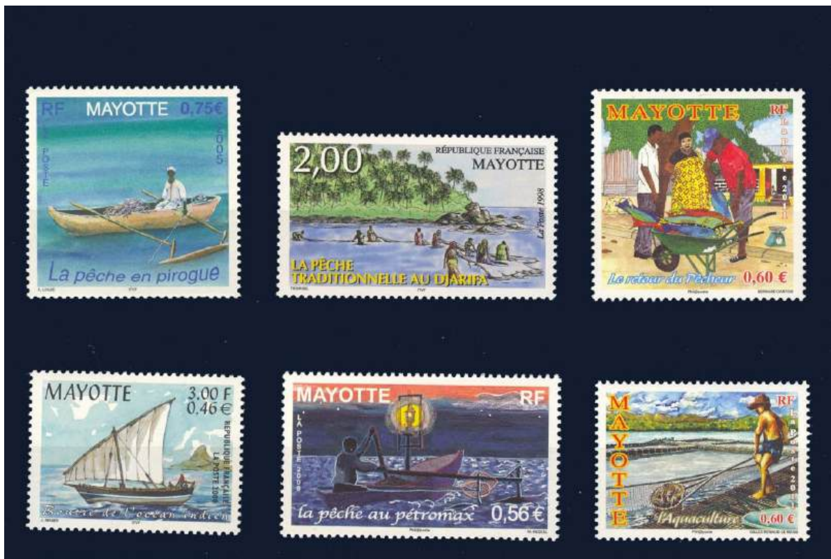
Fischfang und –verkauf