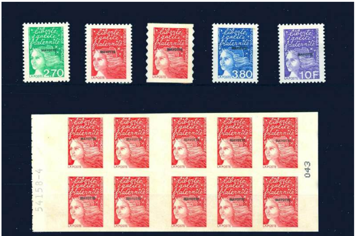
Marken und Heftchen