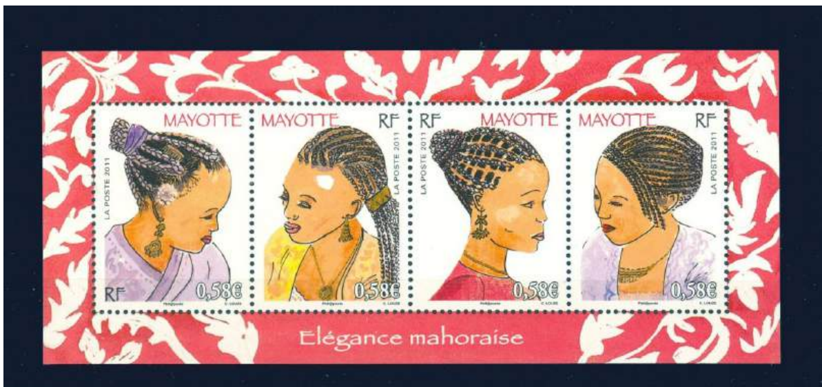
Block mit Eleganten Haartrachten der Inselbewohnerinnen