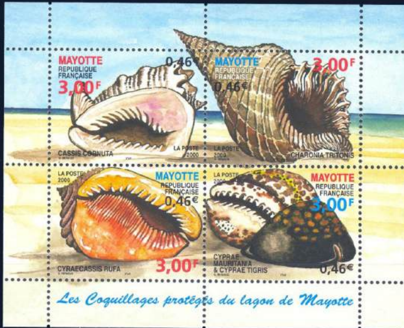
Meeresschnecken aus der Lagune