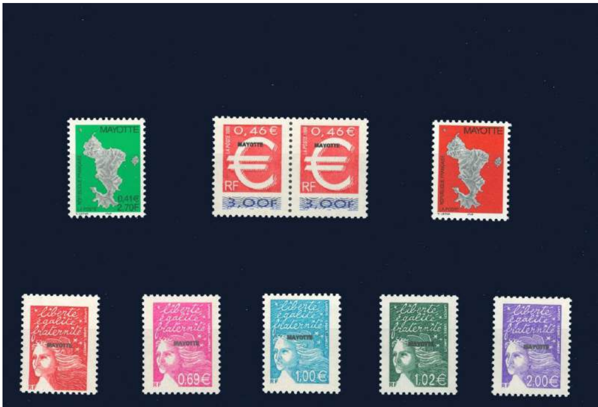
Marken ab 2002 von Frankreich mit Aufdruck Mayotte in Euro-Währung und neue Dauerserie.