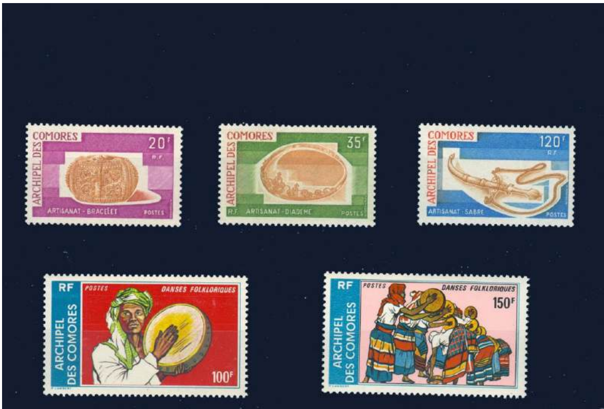
Kunsth Handwerk und Folklore