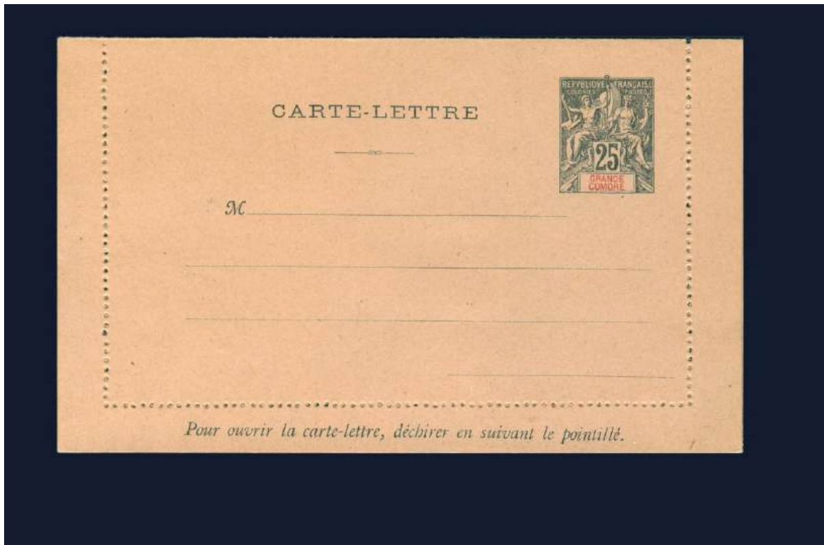
Ganzsache Kartenbrief von 1892. Leider nur von Grand Comore .