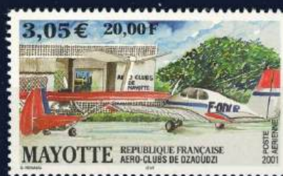
Flugzeuge und Flughafen