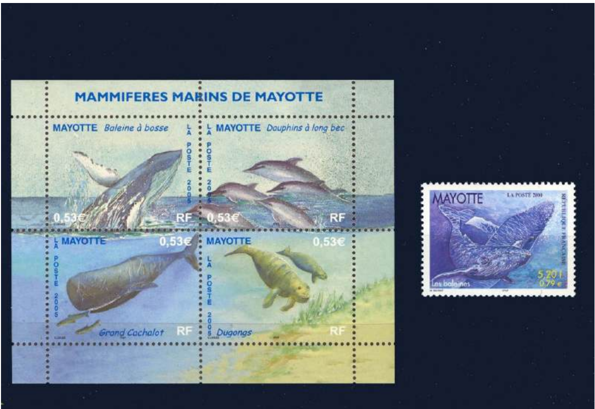
Block mit Meeressäugtieren: Buckelwal, Delphin, Pottwal, Dugong- auch Gabelschwanzseekuh oder Seeschwein genannt, der selten ist