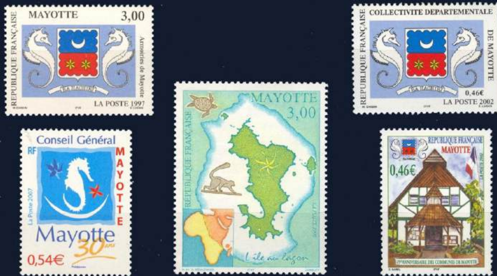
Inselplan und Wappen von Mayotte