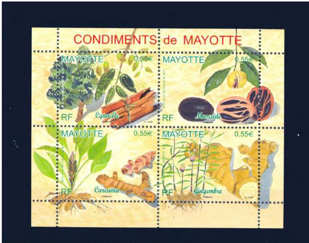
Block mit Gewürzen: Zimt, Muskat, Curcuma, Ingwer