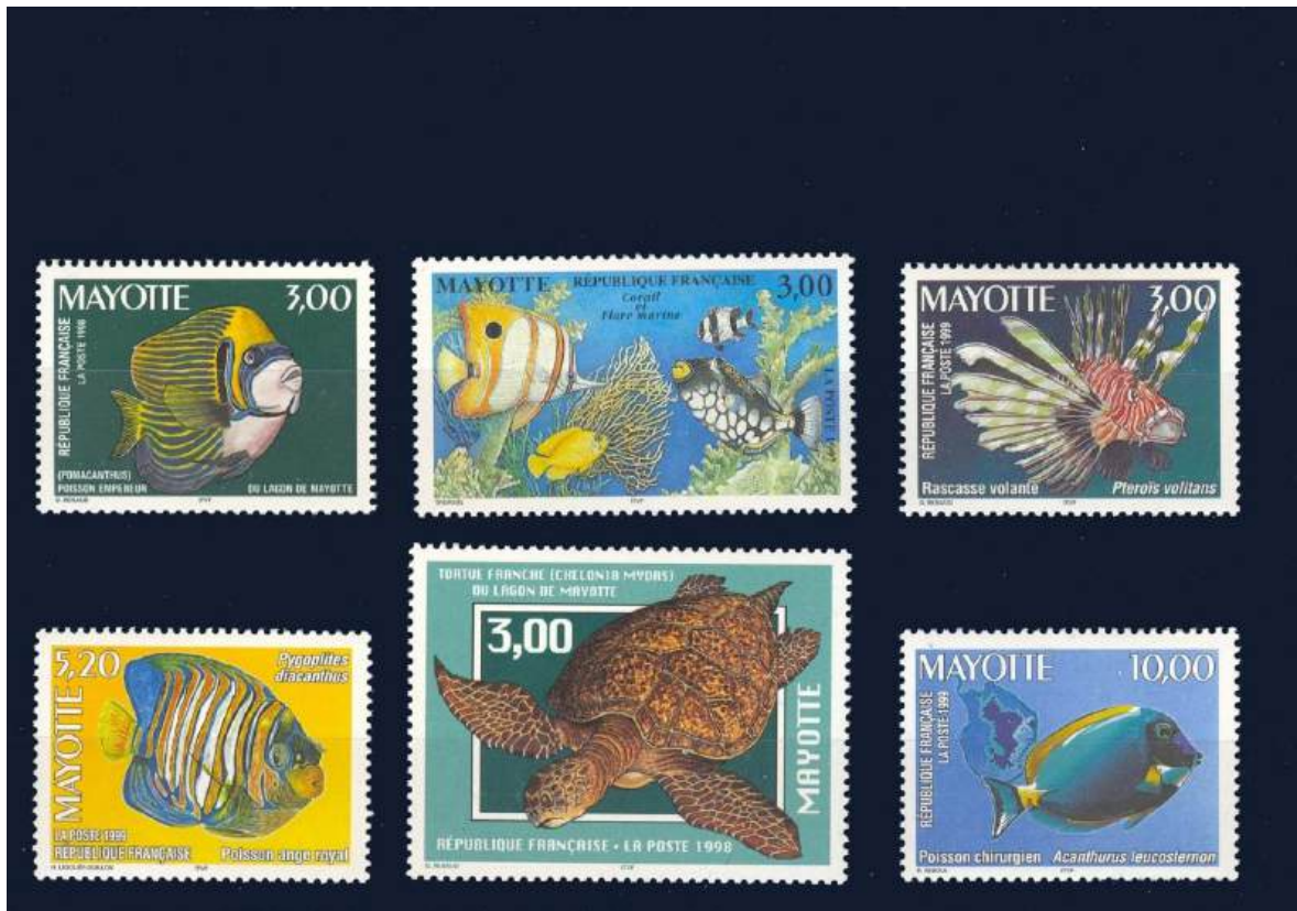
Meerestiere: unter anderem Imperator-Kaiserfisch, Rascasse Volante = Rotfeuerfisch, einer der giftigsten Fische