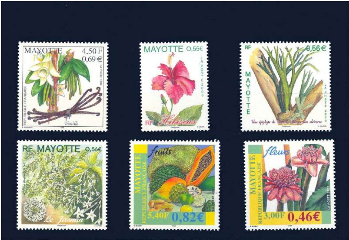
Blumen: unter anderem Vanille, Jasmin, Hibiskus