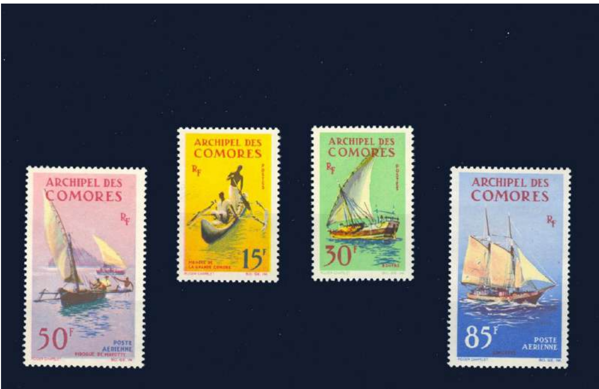
Wasserfahrzeuge der Region: Pirogue von Mayotte