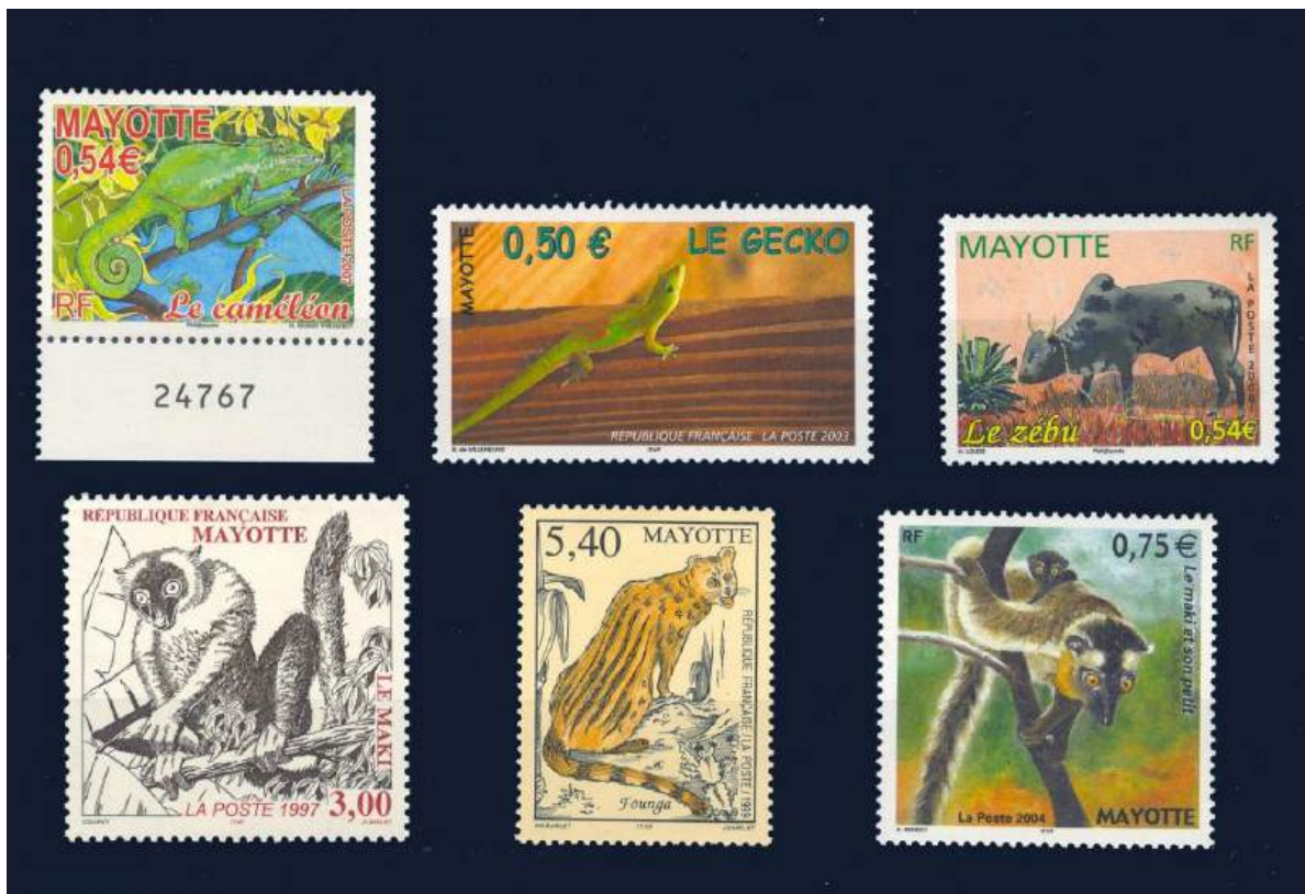
Landtiere von Mayotte