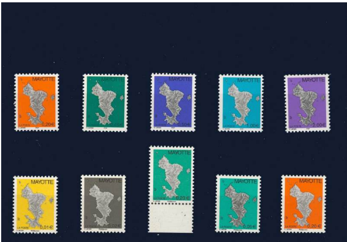
Neue Dauerserie mit Druckereizeichen ITVF (Druckerei für Postwertzeichen und Wertpapiere) unten und mit Philaposte. Marke zu 0,20€ nur 14 Tage, Verwechslung mit 0,05€ wegen gleicher grüner Farbe.