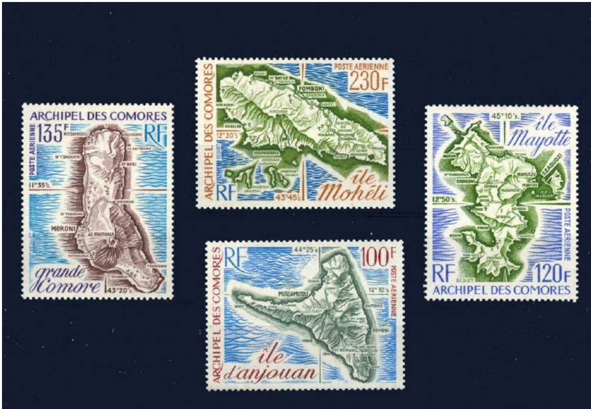
Inselpläne Grande Comore, Mohéli, Anjouan, Mayotte