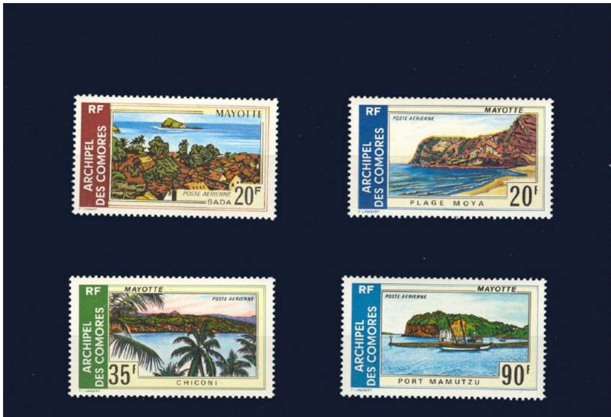
Ansichten von Mayotte