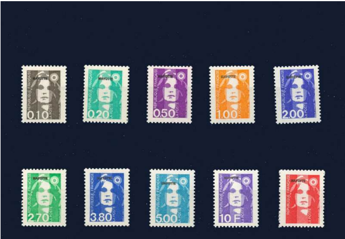
Marken von Frankreich mit Aufdruck Mayotte in Franc-Wahrung