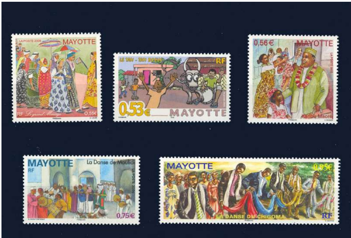
Folklore: Hochzeit, Stierlauf, Willkommensgruß, Religiöses Fest, traditioneller Männertanz auf Hochzeiten