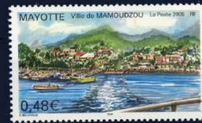
Schiffe, Fähren und Frachtschiffe