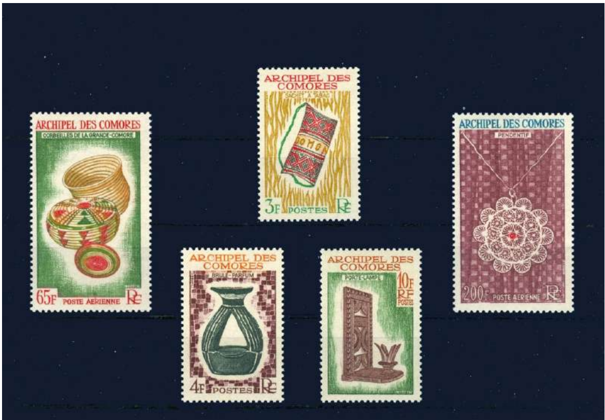
Kunsth Handwerk: Tabakbeutel, Räuchergefäß, Kerzenhalter, Körbchen, Schmuck, Anhänger