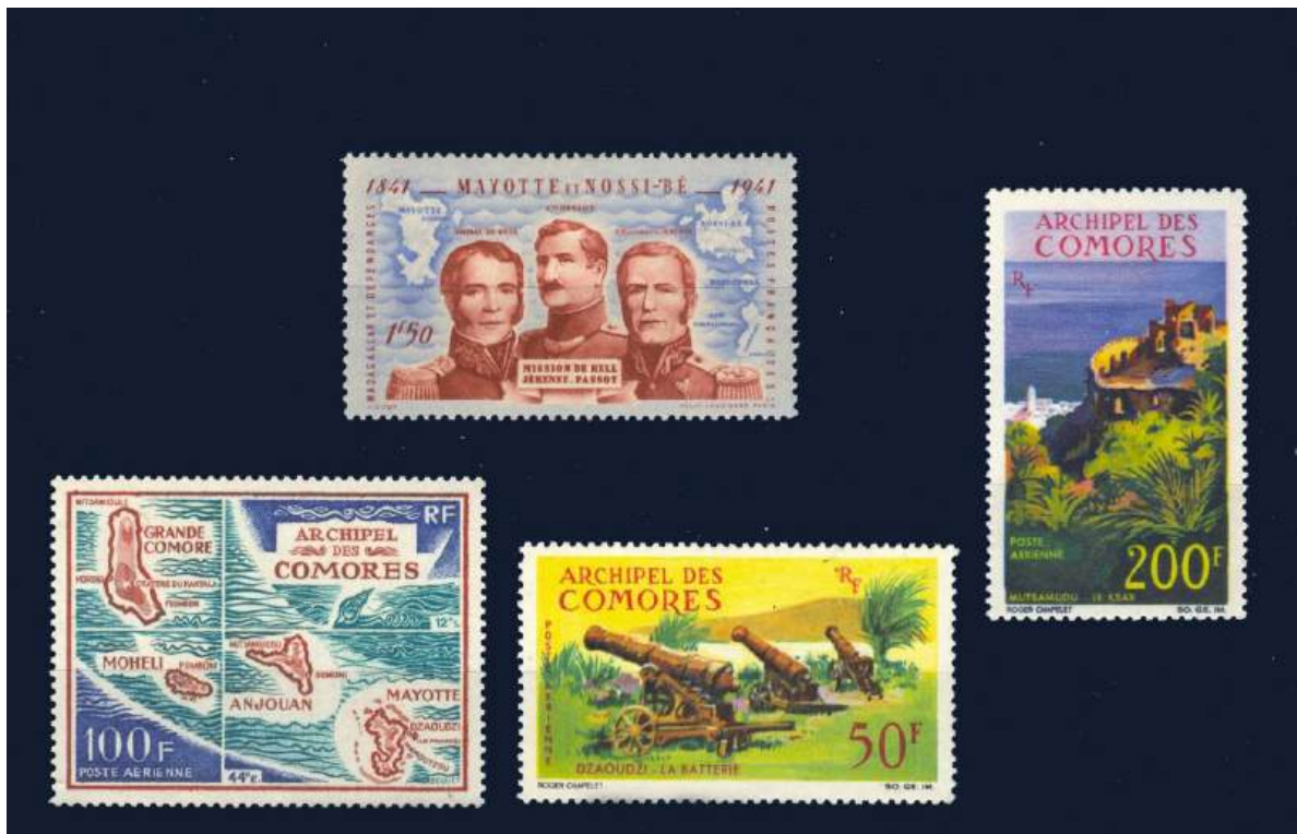
Einzigste Marke von Madagaskar mit Bezug auf Mayotte 100F. Angliederung an Frankreich von 1941. Plan vom Archipel der Komoren, Kanonen und Befestigung von Mamoudzou, Hauptstadt von Mayotte seit 1896.