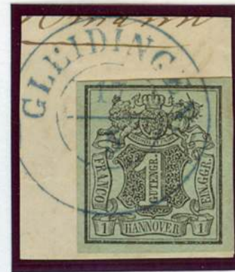
meergrün (Mi.Nr. 2b) Zweikreiser-Stempel / Gleidingen (nach v. Lenthe II/26)