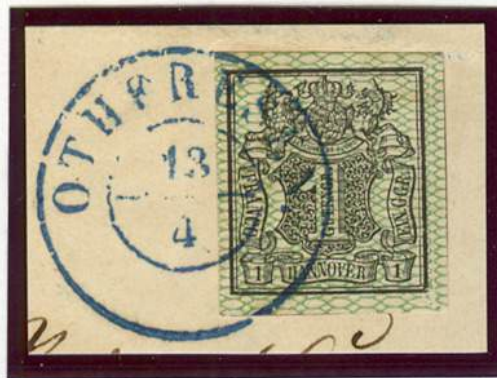
Zweikreiser-Stempel / Othfresen (nach v. Lenthe II/26)