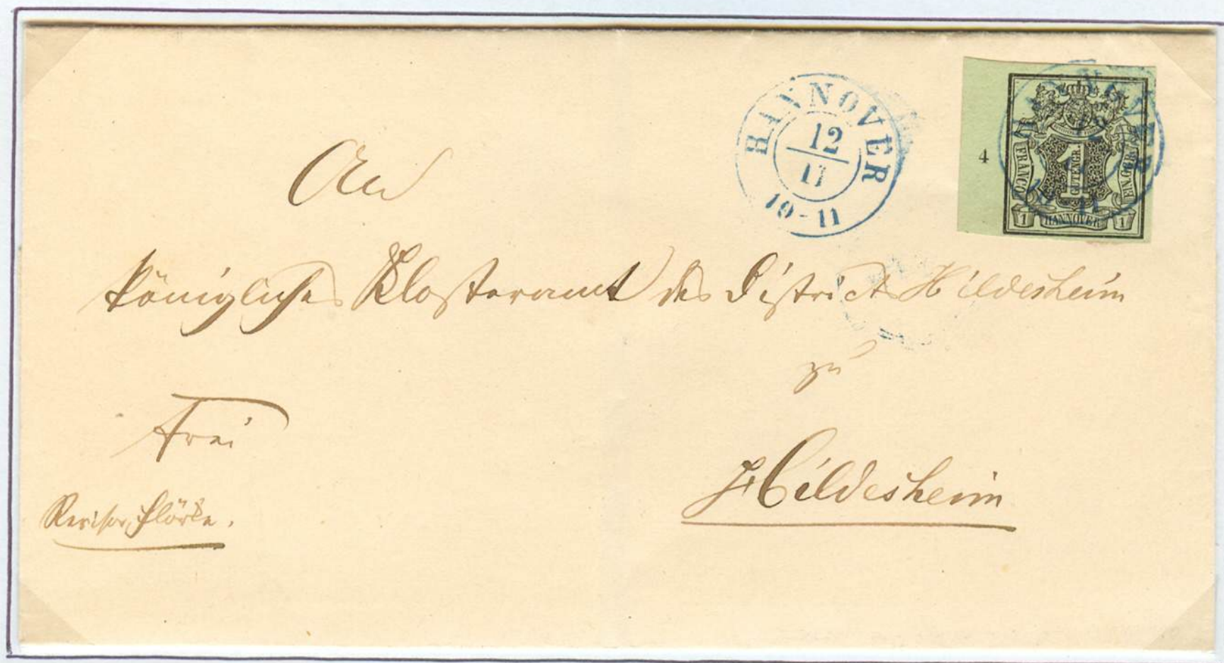
Inlandbrief vom 12. November (Jahr ?) von Hannover nach Hildesheim. Zweikreiserstempel von Hannover (nach v.Lenthe II/24). Brief unter 1 Zollloth Gewicht.