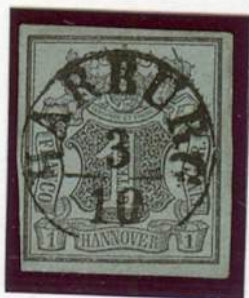
Einkreiser-Stempel / Harburg (nach v. Lenthe b)