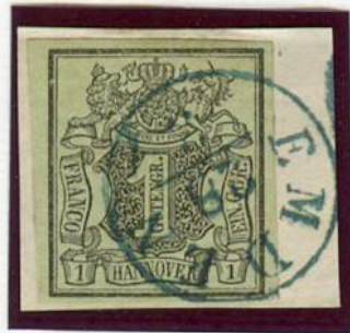
graugrün (Mi.Nr.2a) Einkreiser-Stempel / Emden (nach v. Lenthe e)