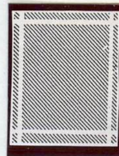
Wasserzeichen 1 (Wz. 1)