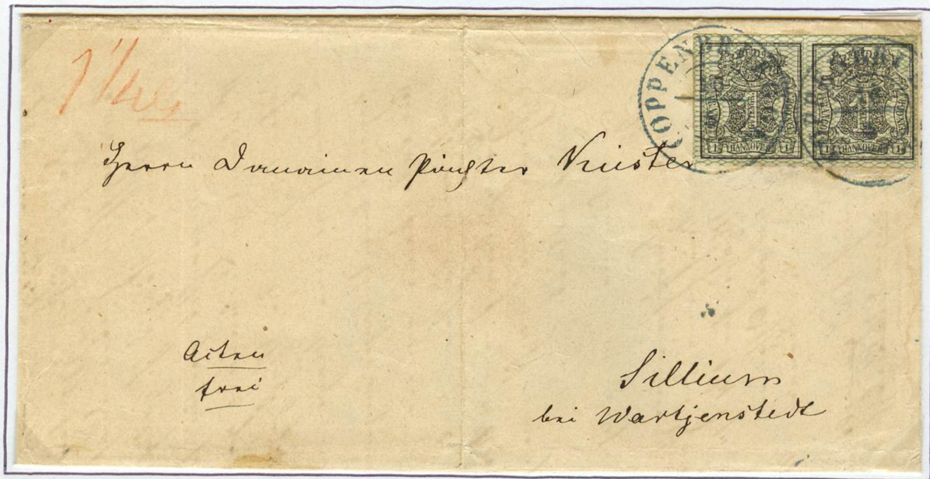
Inlandbrief vom 16. Mai 1857 von Copenbrügge nach Wartjenstedt. Zweikreisstempel von Copenbrügge (nach v.Lenthe II/26). Brief von 1 bis unter 2 Zollloth Gewicht.