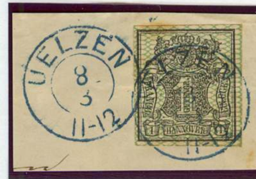
Zweikreiser-Stempel / Uelzen (nach v. Lenthe II/28)