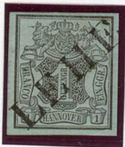
Einzeiler-Stempel / Lehe (nach v. Lenthe I / 29)

auf graublauen farbigen Papier / mit dem Wasserzeichen Linienviereck (Wz. 1)