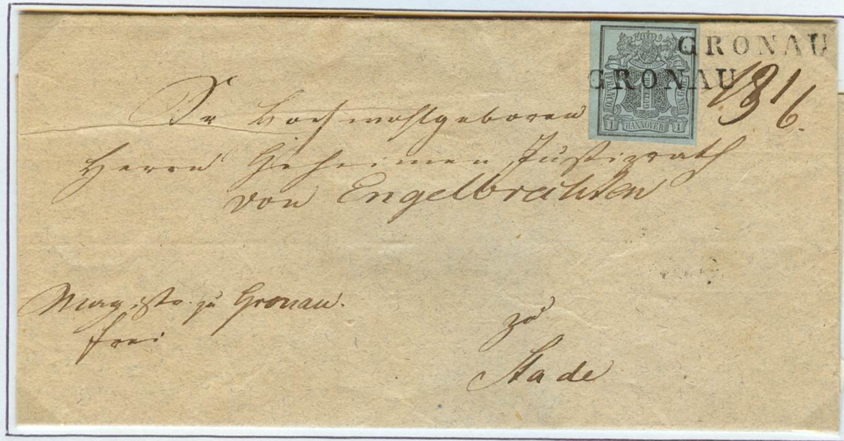
Inlandbrief vom 19. Juni 1851 (handschriftlich) von Gronau nach Stade. Einzeiler-Stempel von Gronau (nach v.Lenthe I/23). Brief unter 1 Zollloth Gewicht.