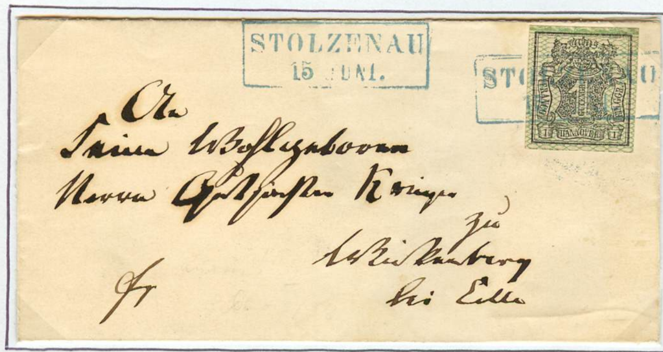
Inlandbrief vom 15. Juni (Jahr ?) von Stolzenau nach Wieckenberg bei Celle. Rahmenstempel von Stolzenau (nach v.Lenthe I/52). Brief unter 1 Zollloth Gewicht.