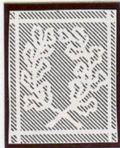
Wasserzeichen 2 (Wz. 2)

auf graugrünen bzw. meergrünen farbigen Papier / mit dem Wasserzeichen Linienviereck mit Eichenkranz (Wz. 2)